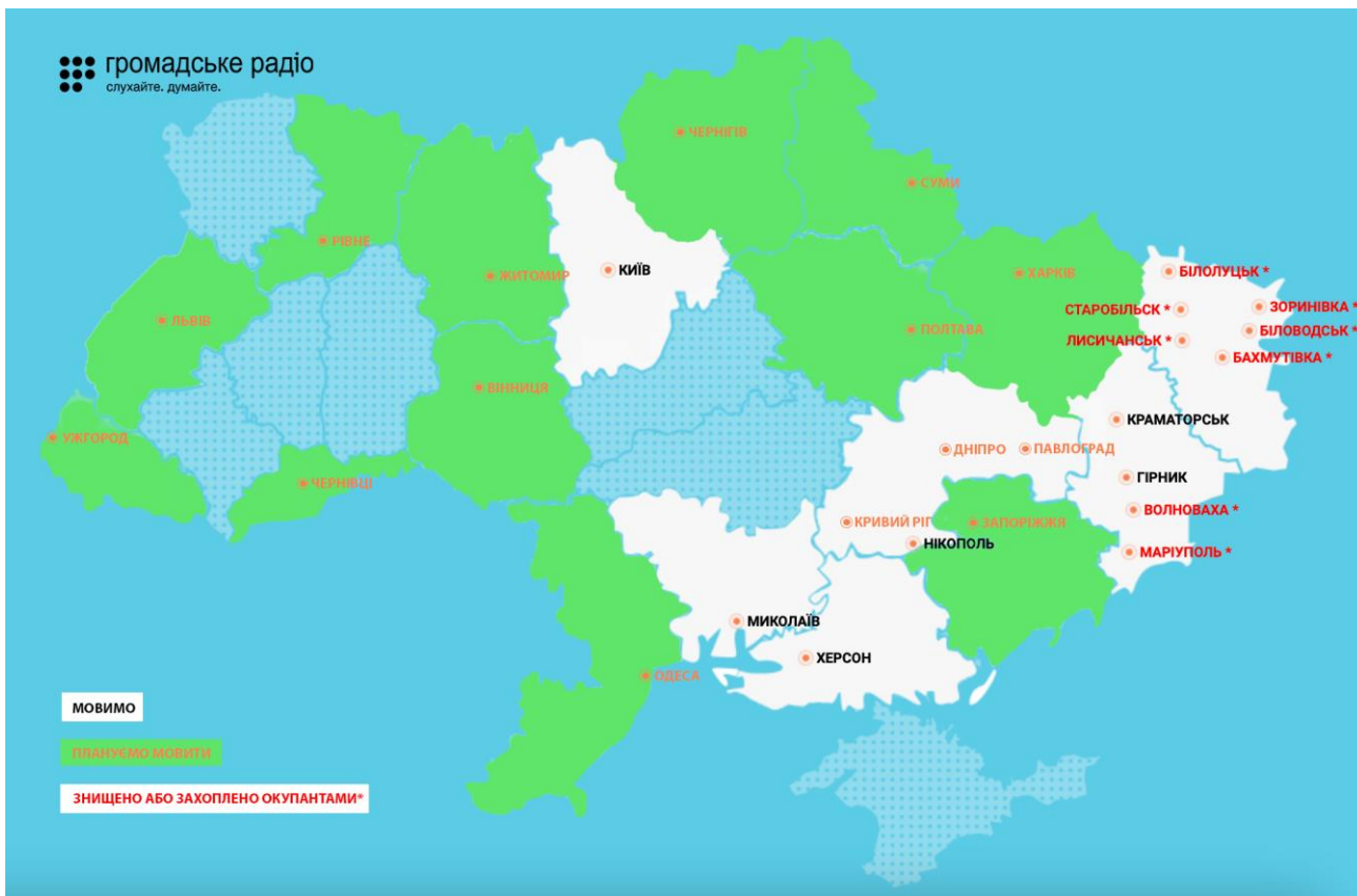
Малюнок 2. Планований розвиток мережі Громадського радіо у 2024-25 роках.

Мовлення у таких містах дає компанії кошти потрібні для мовлення у таких важливих місцях, як Гірник, Краматорськ, Миколаїв, Нікополь та Херсон. Наприклад, Громадське радіо розпочало мовлення у Херсоні за лічені дні після отримання тимчасового дозволу. Це було можливо через доступні рекламні кошти, а також завдяки заздалегідь продуманій закупівлі передавача.