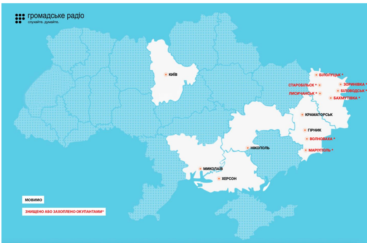
Малюнок 1. Мережа радіомовлення ГР станом на листопад 2023 року (з позначенням втрачених передавачів станом на початок 2022 року).

Після того, як у ході повномасштабного вторгнення вісім передавачів Громадського радіо було вкрадено або знищено росіянами , команда радіо поступово відновлює мовлення на прифронтових територіях. Цьогоріч ми запустили три нові частоти – Нікополь, Миколаїв та Херсон. З Нікополя ми мовимо в тимчасово окупованому Енергодарі, з передавача у Херсоні ми мовимо на тимчасово окупованому лівобережжі Херсонщини.